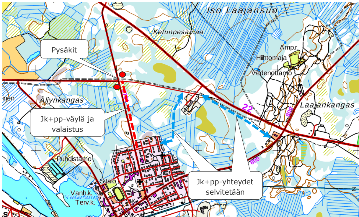
Kuva 4. Liikenteelliset toimenpide-esitykset.