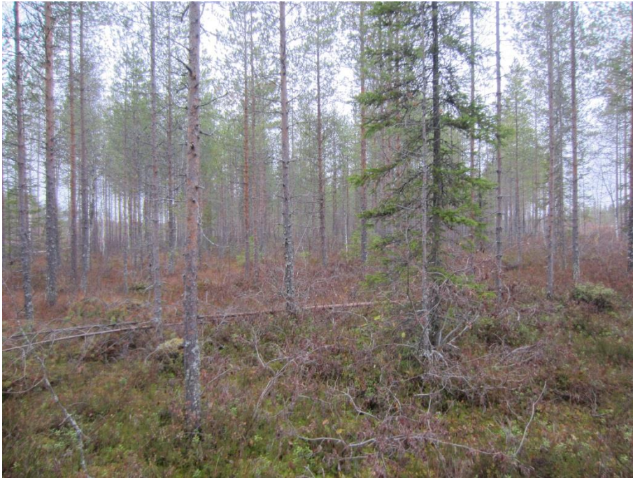
Kuva 3-2. Metsänuudistusalueiden reunustama kangasrämemuuttuma suunnittelalueen keskiosassa.