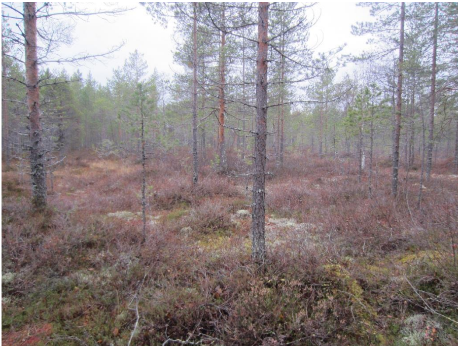
Kuva 3-1. Harvapuustoista karua nevarämemuuttumaa suunnittelualueen eteläosassa.