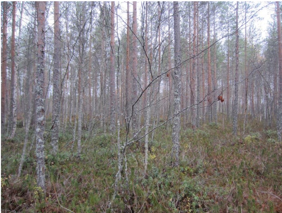
Kuva 3-3. Puolukkaturvekangasta suunnittelalueen eteläosassa.