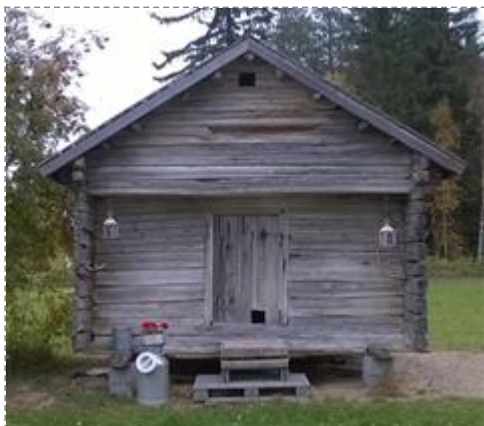
Kekkolan aitta