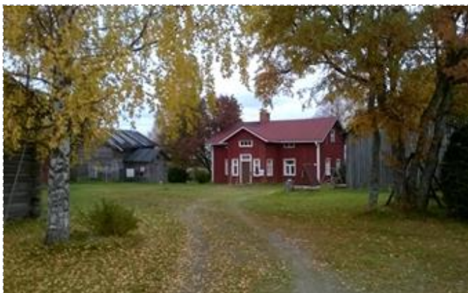
Lassilan pihapiiri