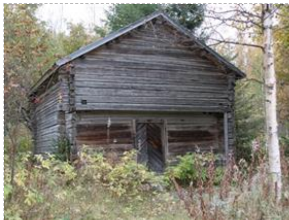
Kangas-Tervolan asuinrakennus (Kuva: Kirsti Reskalenko 2016) Aitta (Kuva: Kirsti Reskalenko 2016)