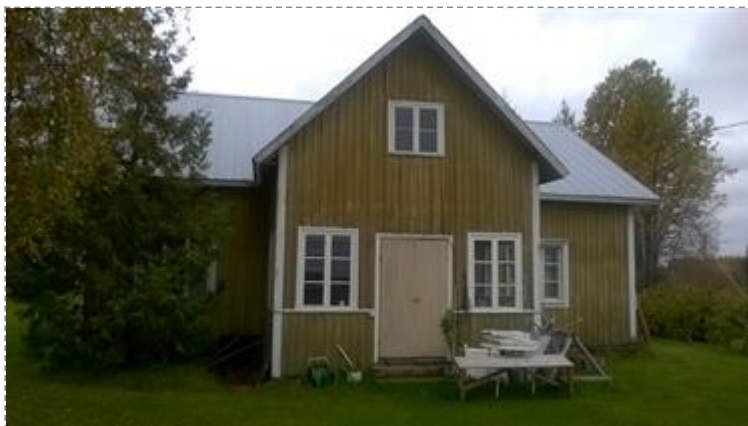
Vanha päärakennus