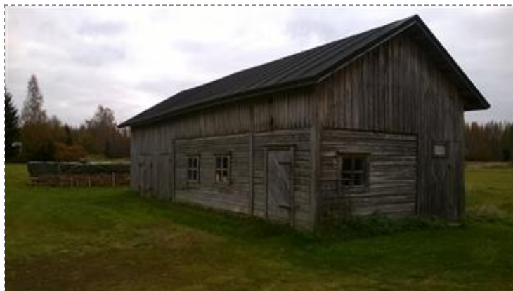
Suutarilan navetta