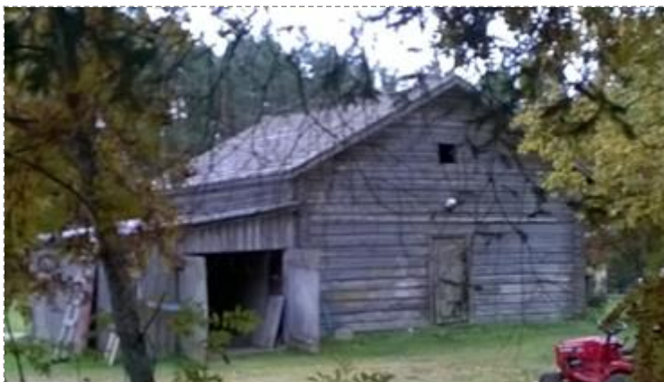
Talusrakennus, jonka päätyverhouksessa on jäljellä pärevuorausta.