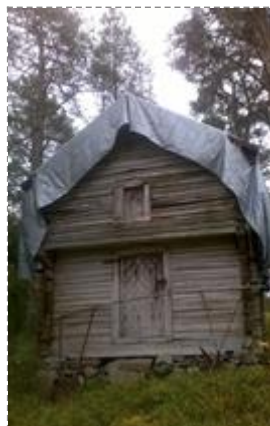
1850-luvun aitta (Kuva: Kirsti Reskalenko 2016)