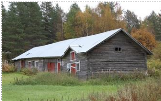
Leinolan navetta ja talli