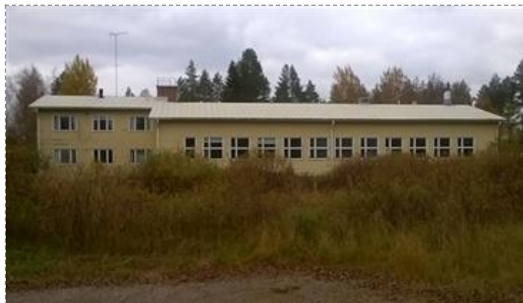
Jaalangan koulu