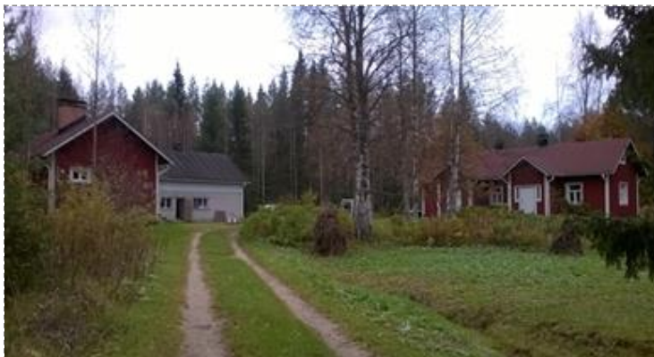
Ojanperän pihapiiri