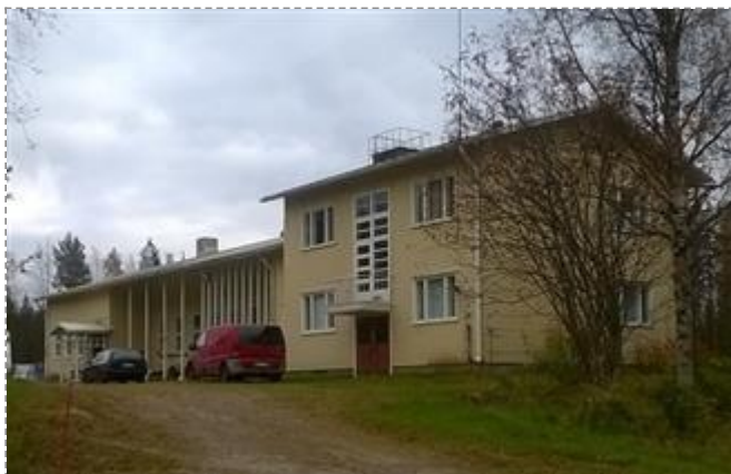
Jaalangan kansakoulu