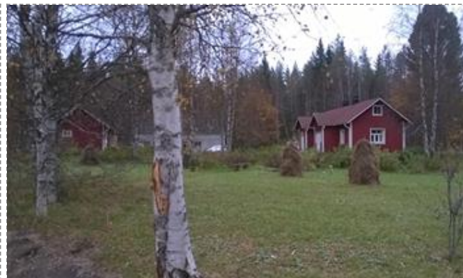
Ojanperän pihapiiri