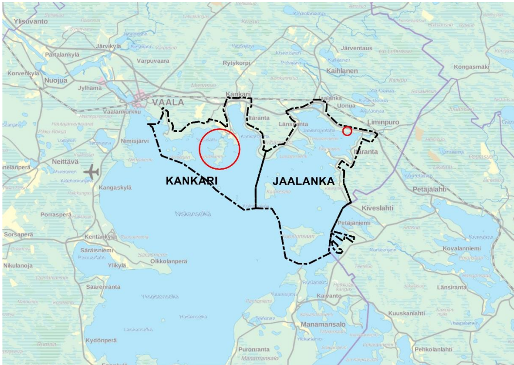
Kuva 2. Punaisella ympyröitynä Neulaniemen perinnemaisemakohteen sijainti vasemmalla Kankarin rantayleiskaavan alueella ja oikealla soidensuojeluhjelmakohteen Jaalangan tervaleppäkorven sijainti Jaalangan kaava-alueella.