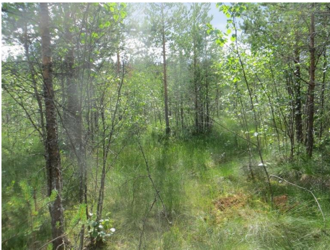
Kuva 5. Neulaniemen koillisosan ojitetulla rämeellä aluskasvillisuus on heinäistä.