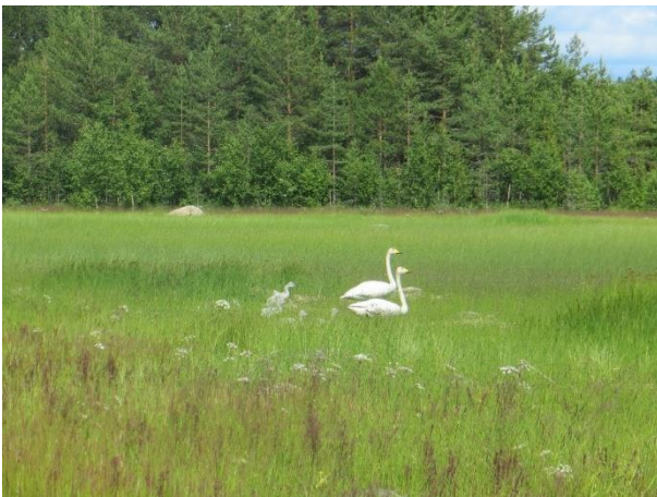
Kuva 11. Joutsenperhe Neulaniemen itärannan niityllä.

Maastokäynnin yhteydessä havaittiin Neulaniemen itärannalla laulujoutsenperhe (kuva 10) sekä runsaasti lokkeja. Alue on rajattu liitteen 1 karttaan linnustollisesti arvokkaana alueena.