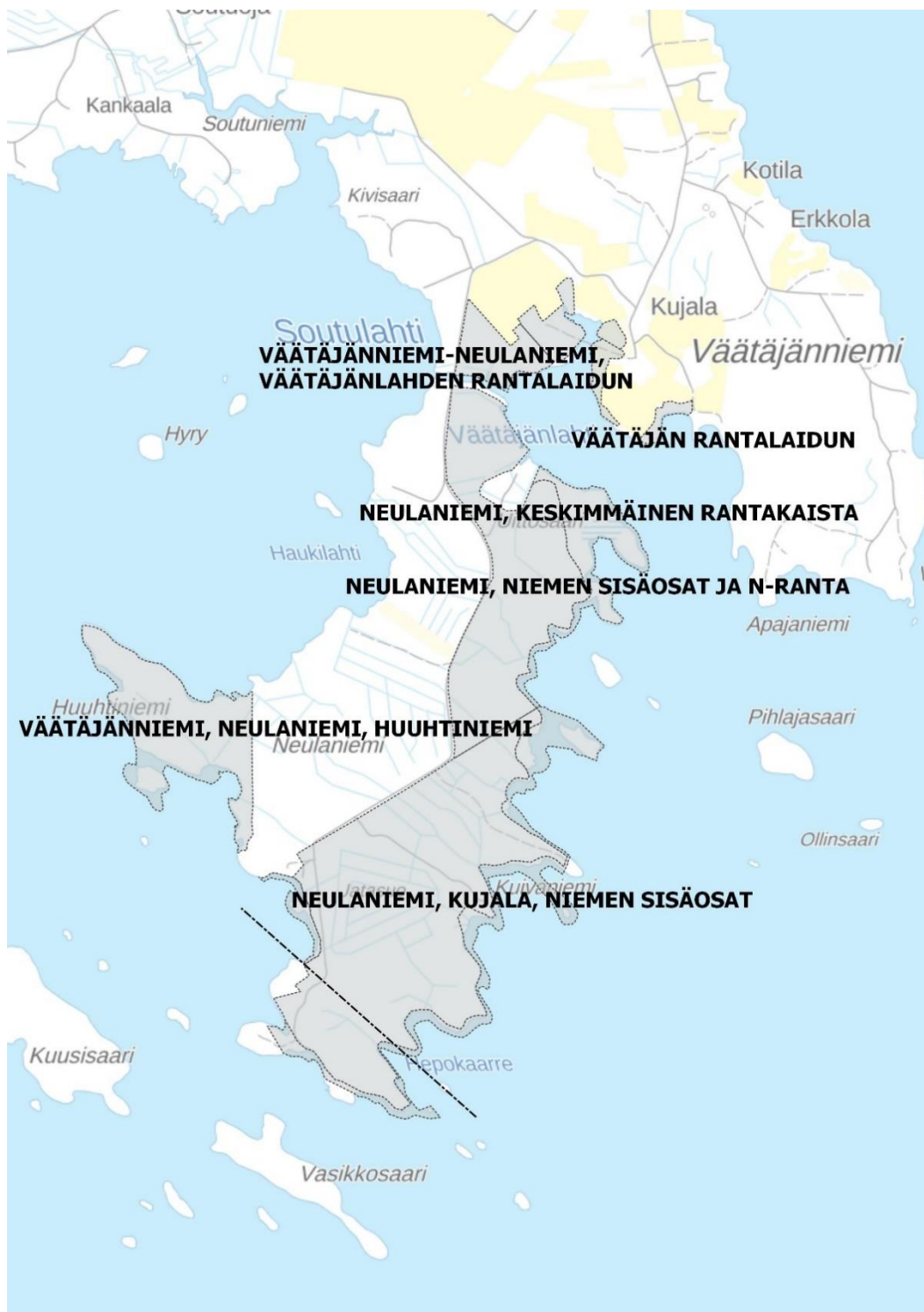
Kuva 3. Perinnebiotooppirajaukset (Pohjois-Pohjanmaan ELY 2019).