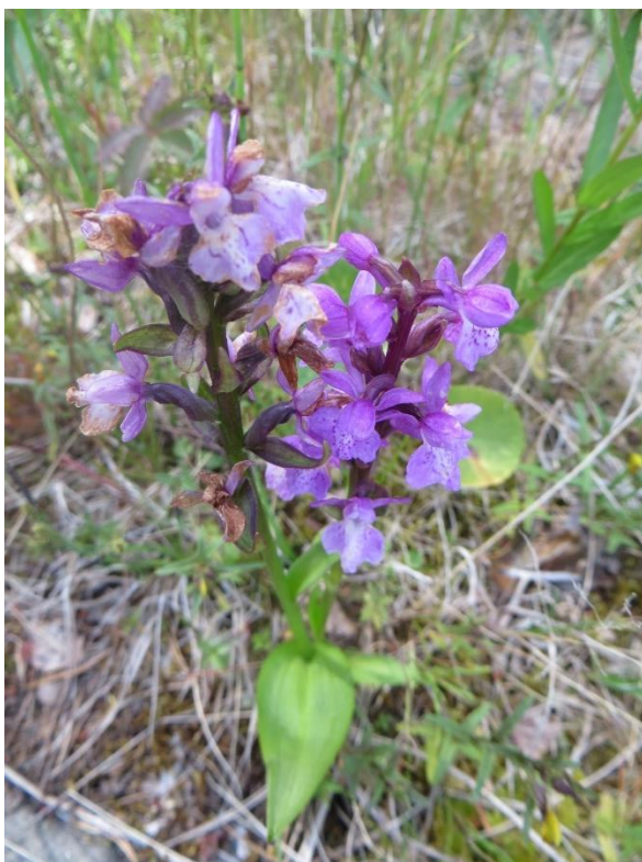
Kuva 9. Suopunakämmekkää kasvaa Neulaniemen itärannan niityllä.

Uhanalaisuusluokitukseltaan (Hyvärinen ym. 2019) silmälläpidettävää (NT) suopunakämmekkää löytyi niemen itärannalta parista kohtaa rantaniityltä. Suopunakämmekän elinympäristöä ovat ravinteiset ja keskiravinteiset suot ja kosteat suo- ja rantaniityt. Se on vähentynyt ojitusten, turpeenoton ja rakentamisen vuoksi (Ympäristö.fi).