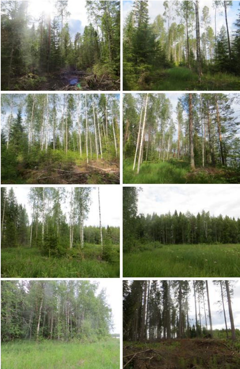
Kuva 14. Valokuvia alueelta. Alueella ei ole nykyisellään erityisiä luontoarvoja.