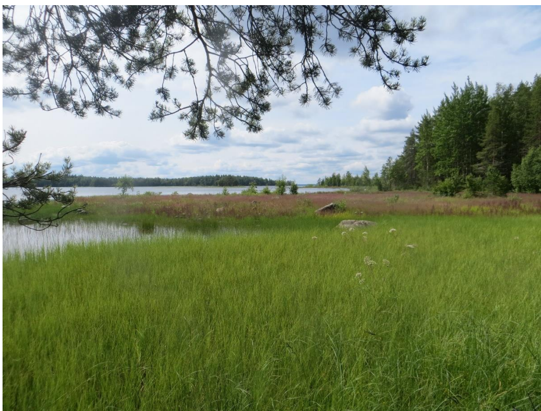
Kuva 6. Avointa niittyä Neulaniemen lounaisrannalla. Etualalla kosteampaa saraniittyä, taustalla kuivempaa heinäniittyä.

Suomen luontotyyppien uhanalaisuusluokituksen mukaan sisävesien suursaraniityt ovat sekä koko maassa että Etelä-Suomessa, johon Vaala luetaan, erittäin uhanalaisia (EN). Sisävesien matalakasvuiset vihvilä-, heinä- ja saraniityt ovat koko maassa ja Etelä-Suomessa äärimmäisen uhanalaisia (CR).