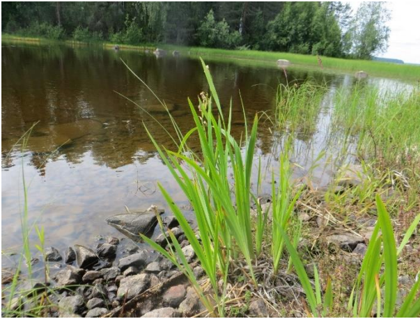
Kuva 10. Keltakurjenmieikka.