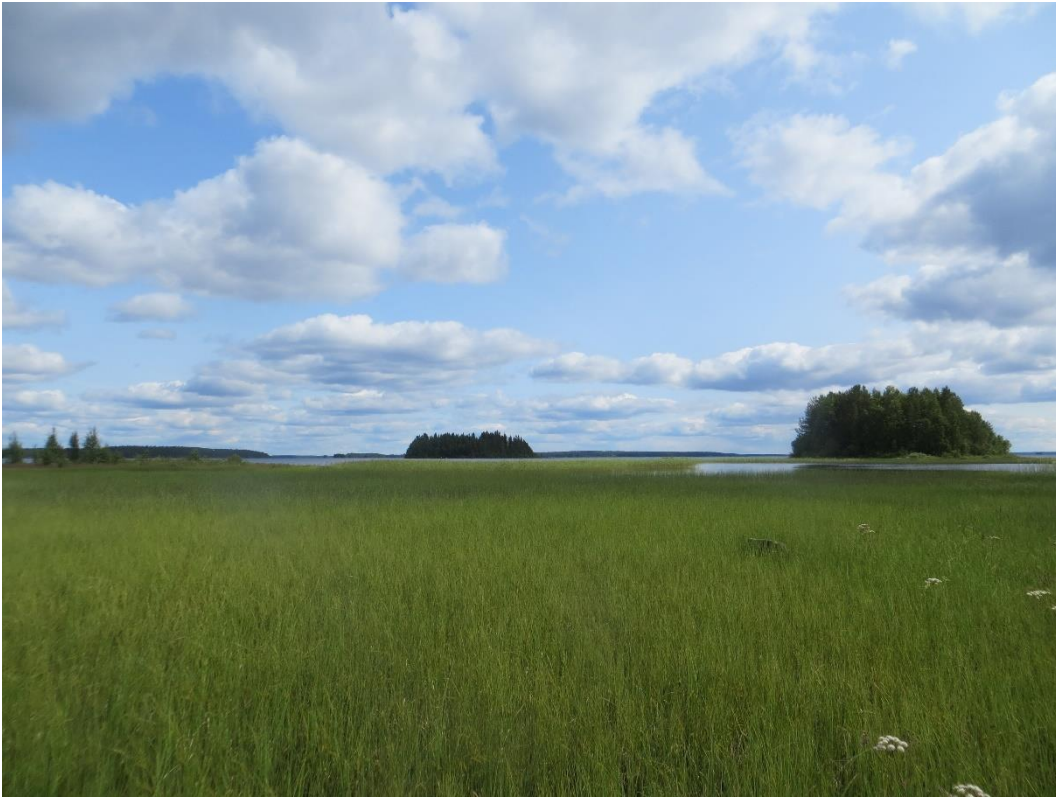
Kuva 7. Laaja avoin niitty Neulaniemen itärannalla. Kuvan saaret ovat Kekkolanniemi ja Raatosaaari.

Väätäjäniemessä on edelleen laidunnusta (kuva 8), mutta Neulaniemestä se on kokonaan loppunut.