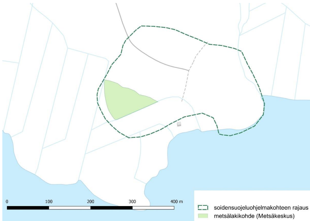
Kuva 12. Jaalangan tervaleppäkorven soidensuojeluohjelmakohteen rajaus ja metsälain mukainen erityisen tärkeä elinympäristö Metsäkeskuksen Metsään.fi-karttapalvelun mukaan.

Soidensuojeluohjelmakohteen ja metsälakikohteen rajaukset on esitetty peruskarttapohjalla kuvassa 12 ja ilmakuvassa kuvassa 13. Kuvassa 14 on esitetty valokuvia alueelta.