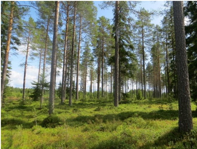
Kuva 4. Neulaniemen keskiosan talousmetsää.

Laidunnus Neulaniemen alueella on loppunut vuosia sitten. Neulaniemen keskiosissa on talouskäytössä olevaa metsää hakkuineen ja taimikoineen eikä laidunnuksen vaikutus kasvillisuudessa näy enää. Huhtikarin edustan ja Neulaniemen koillisosan soisilla alueilla laidunnuksen vaikutus näkyy aluskasvillisuuden heinävaltaisuuksena edelleen. Metsäisillä alueilla ei esiinny perinnebiotooppeja.