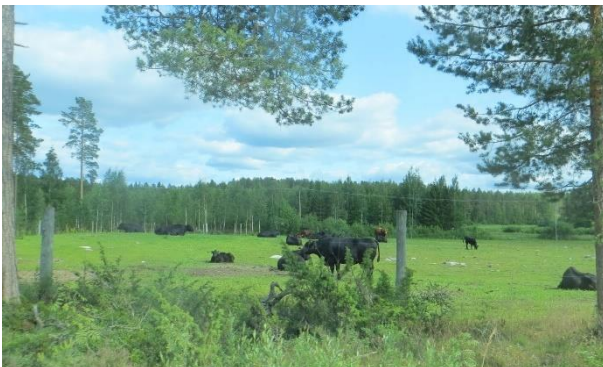
Kuva 8. Laidunnusta Väätäjäniemen pelloilla.

Väätäjäniemessä on edelleen laidunnusta (kuva 8), mutta Neulaniemestä se on kokonaan loppunut.