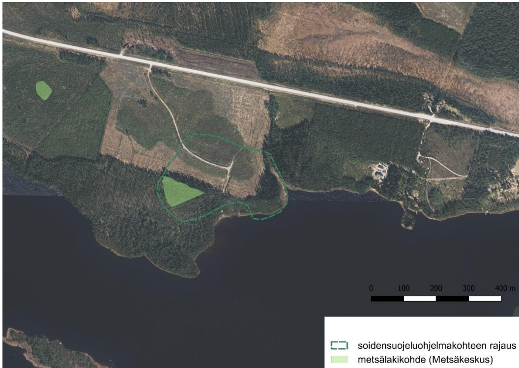
Kuva 13. Jaalangan tervaleppäkorven soidensuojeluohjelmakohteen rajaus ja metsälain mukainen erityisen tärkeä elinympäristö Metsäkeskuksen Metsään.fi-karttapalvelun mukaan. Ilmakuvassa erottuvat hyvin alueella tehdyt hakkuut. Tämän lisäksi rantametsä on harvennettu.