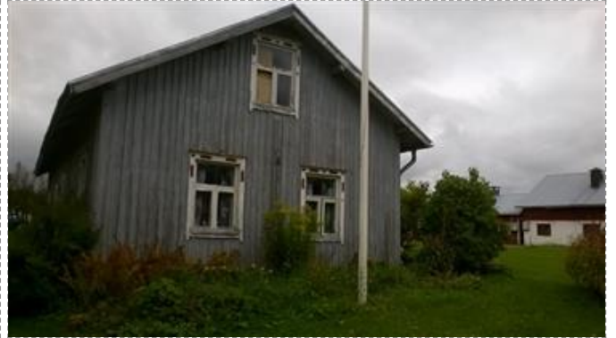
Vanha asuinrakennus ja navetta