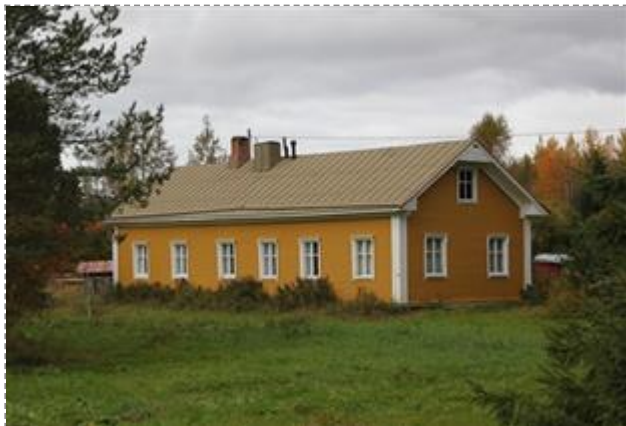
Kangasojan talo näkyvällä paikalla Kajaanintien varrella