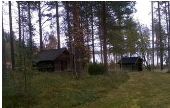
Kesälän aittoja (Kuva: Kirsti Reskalenko 2016)