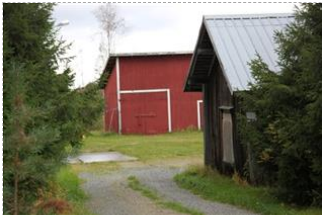
Kangasojan pihaa